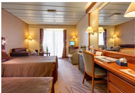
Kabine MS Artania