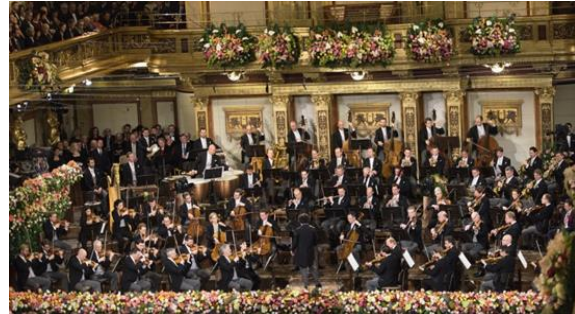
Wiener Philharmoniker