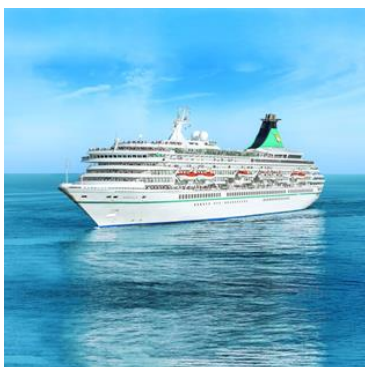
MS Artania