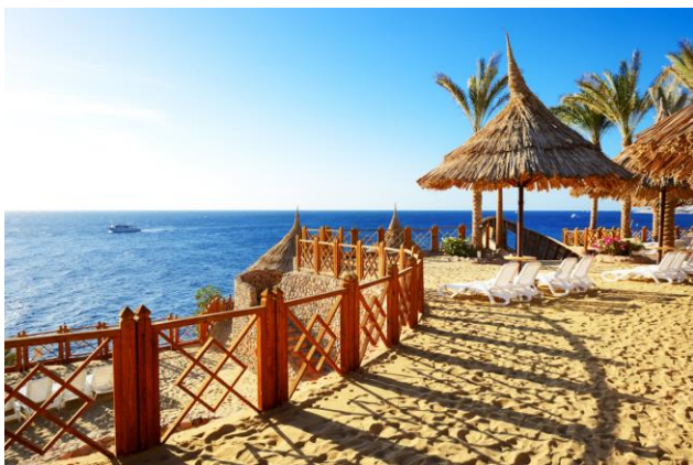
Ägypten als großer Gewinner zu Ostern

Presstext und druckfähiges Fotos finden Sie unter: