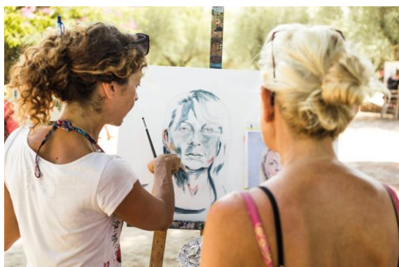
Sommerakademie Zakynthos